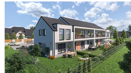
Widok na ogrody