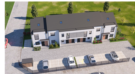
Widok na budynek z lotu ptaka na front